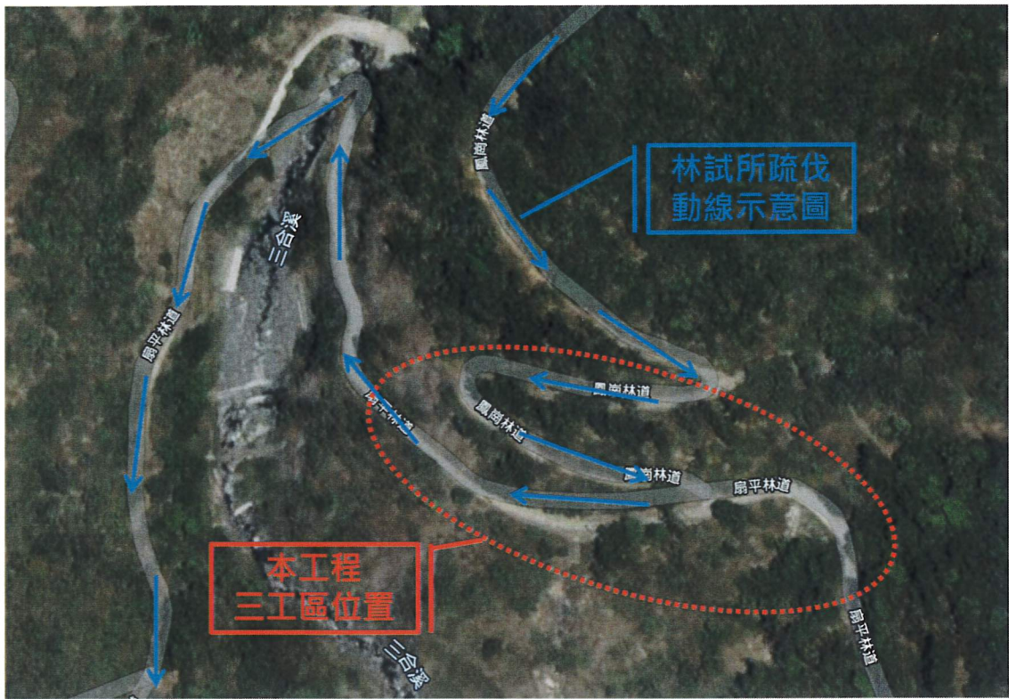
2. 林試所疏伐木清運動線與本分局三工區位置